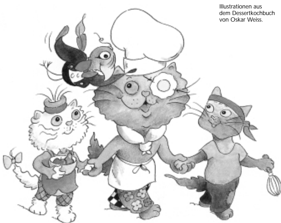
Illustrationen aus dem Dessertkochbuch von Oskar Weiss.

"Kochen mit Cocolino" ist jedoch mehr als ein Kochbuch für Kids. Cocolino ist eine Idee. In dieser Zeit mit der problematischen Ernährungsweise grosser Teile der Gesellschaft wollen die beiden Autoren mit ihren Konzepten einen positiven Beitrag leisten. Sie planen, die Kinder und auch die Eltern mit